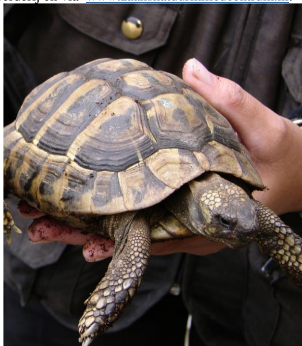
Griekse landschildpad

Het adres van de boerderij is De Weer 31 1504AH te Zaandam. Meer info op de facebookpagina van de stadsboerderij en via www.zaansnatuurmilieucentrum.nl .